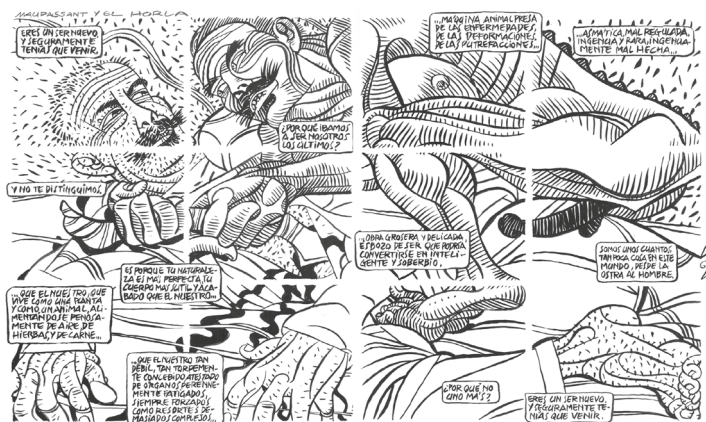
Fig. 5: Cava et Sanyú, El hombre descuadernado , ©Edicions de Ponent, 2009, p. 41-42.

La première [Fig. 5], celle intitulée «Maupassant y el Horla» (chap. 14, 41-42) se présente comme une illustration du cauchemar de la nuit du 5 juillet comme on le comprend à la lecture des notes du diariste de la nouvelle : «Figurez-vous un homme qui dort, qu'on assassine, et qui se réveille, avec un couteau dans le poumon, et qui râle couvert de sang [...]» (Maupassant 288). Première source d'étonnement, là encore, alors que le dessin de Sanyú renvoie sans ambiguïté au cauchemar du 5 juillet, les textes de Cava sont des citations exactes d'extraits du 19 août qui, force est de le constater, ne font nullement référence à la scène dessinée. Le seul lien existant entre le texte et sa mise en image réside dans le titre du chapitre : «Maupassant y el Horla». Tout laisserait à penser ici que le dessinateur n'en a fait qu'à sa tête et qu'il a utilisé le cahier des charges fixant six cases par page à sa guise. Or, il n'en est rien. Sanyú a suivi à la lettre le scénario de Cava 28 .