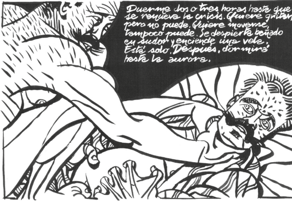
Fig. 1 : Cava et Sanyú, El hombre descuadernado , ©Edicions de Ponent, 2009, p. 13, C2.

Les quatre premières pages de l'album plantent le décor et multiplient les références à la journée du 8 mai. Suivant le rythme rapide de la nouvelle, la fièvre ne tarde pas à arriver (chapitre 2-3-4), ce qui va permettre à Cava d'introduire le thème de la maladie (la syphilis), de la folie et du double.