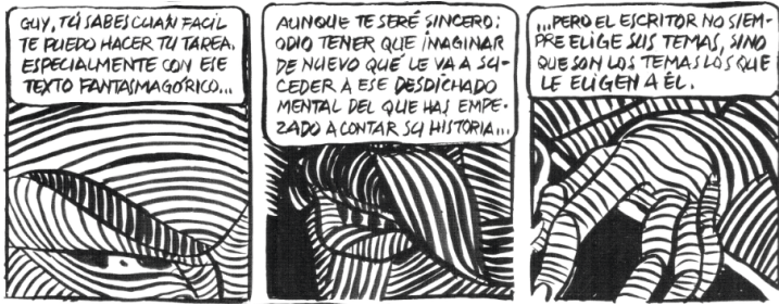
Fig. 2 : Cava et Sanyú, El hombre descuadernado , ©Edicions de Ponent, 2009, p. 15, C2-3-4.

d'ailleurs : si cet œil torve ne peut qu'inspirer la peur [Fig. 2], alors que dire du gros plan sur la main qui renvoie aussi bien à la main de l'étrangleur qu'à l'imaginaire monstrueux du membre sectionné qui devient autonome au point de mener son existence propre ? Cette main zébrée, crispée, écorchée 23 n'est plus humaine, elle est au mieux animale, au pire surnaturelle, extraterrestre..