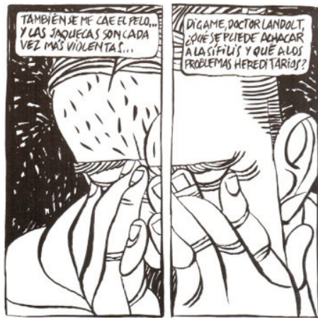
Fig. 4 : Cava et Sanyú, El hombre descuadernado , ©Edicions de Ponent, 2009, p. 11, C2-3.

de Maupassant apparaît en page 11 [Fig. 4], en gros plan, scindé en deux cases : la moitié gauche, entaillée de multiples rayures, suggère la présence du mal alors que l'autre moitié présente un aspect normal. Ce n'est qu'après avoir pris soin de symboliser la schize du sujet par ce dispositif de fracture iconique, et après avoir pris la précaution de nommer la maladie dans un dialogue sans ambages 24 , que Sanyú peut enfin se permettre de faire entrer en scène le Horla. Son irruption se fait à la dernière case de la troisième et dernière page du chapitre 4 : il nous apparaît accroupi sur le corps de Maupassant, une main autour de son cou, en train de l'étrangler. Sa nudité, son hirsutisme et sa musculature saillante en font un double primitif de Maupassant, une sorte de figure archaïque échappée des profondeurs de l'inconscient. Véritable Doppelgänger , émanation maléfique, morbide et rivale de Maupassant, le Horla n'aura de cesse de harceler son maître et de le pousser au suicide afin de prendre sa place.