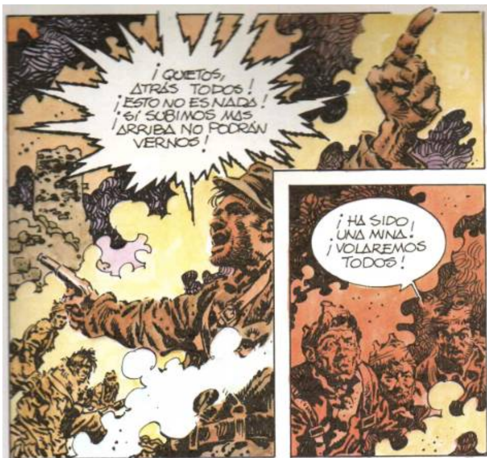
Illustration 1 : AntonioHernández Palacios, Río Manzanares , Vitoria, Ikusager, 1979, p. 21, cases 1-2-3.