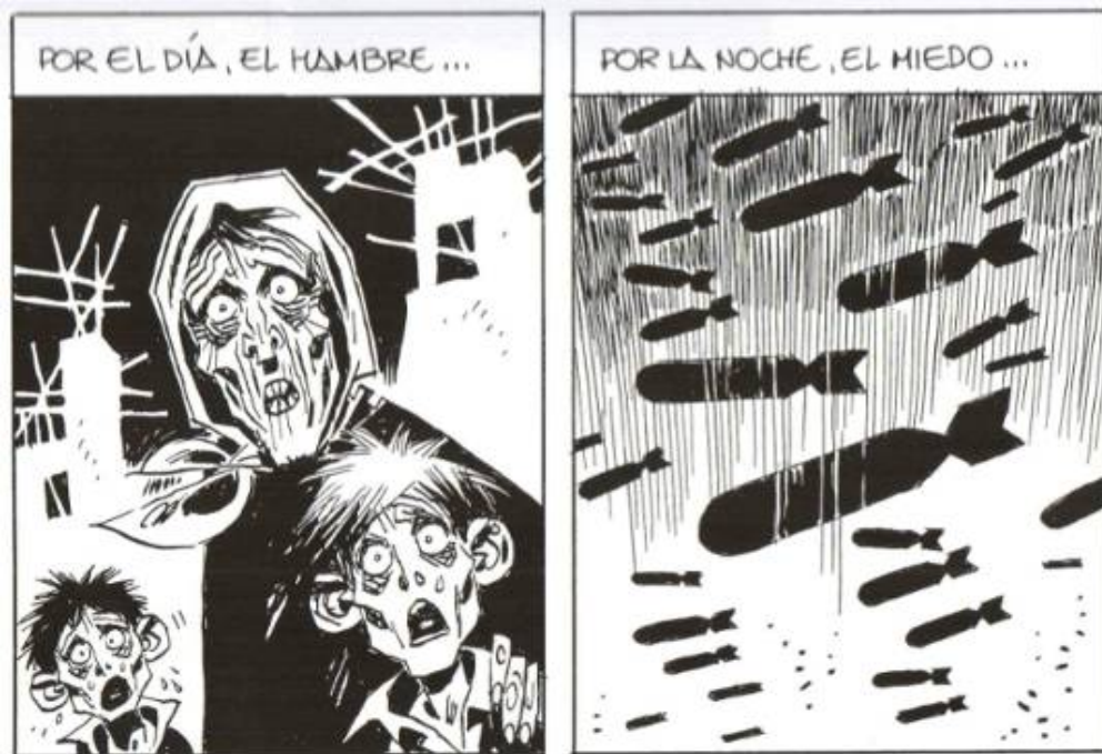
Illustration 3 : Carlos Giménez, 36-39. Malos Tiempos , vol.3, Barcelone, Glénat, 2008, p.7, cases 2-3.