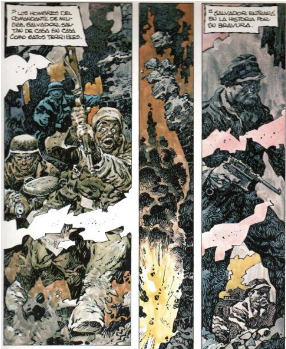
Illustration 2 : AntonioHernández Palacios, Eloy, uno entre muchos , Vitoria, Ikusager, 1979, p. 17, cases 1-2.