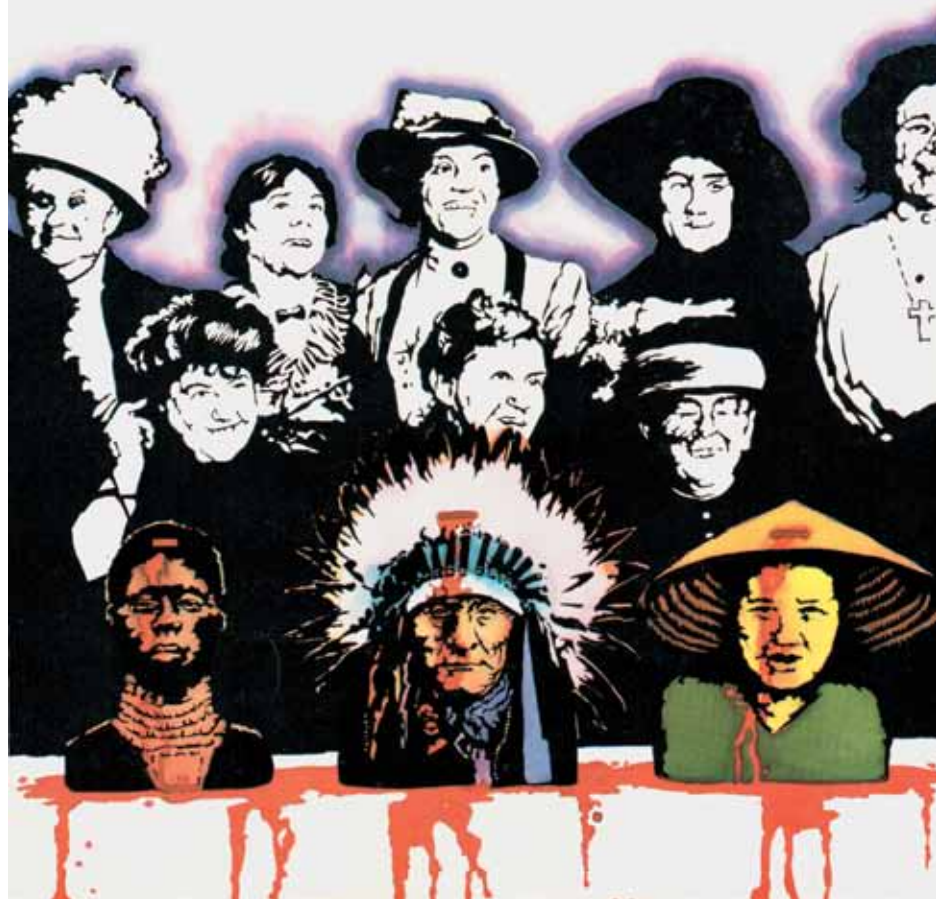
Ill. 1. El Cubri, El que parte y reparte se queda con la mejor parte , Madrid, 1975, © Fundamentos, couverture