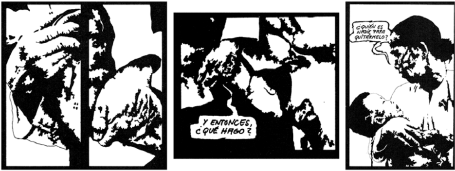
Ill. 5. El Cubri, El que parte y reparte se queda con la mejor parte , Madrid, 1975, © Fundamentos, p. 3 (2-3), p. 4 (3), p. 5 (3)

des codes de la bande dessinée classique, El Cubri s'est tourné vers une sorte d'esthétique de la laideur qui s'applique à tous les échelons de la planche. Celle-ci se manifeste d'abord au niveau des cases par la présence récurrente de très gros plans saturant l'espace vignettal de telle manière qu'il en devient presque impossible d'identifier l'objet représenté (ill. 5, les trois premières images). Ce cas de figure, présent dans diverses nouvelles de l'album, pourrait être caractérisé de déformation par effet de loupe ou de poétique de l'émiettement .