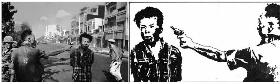
Ill. 4. Saigon execution (1968)

façon presque tautologique, l'exécution d'un Viêt-cong en plein cœur de Saïgon par le chef de la police du Sud-Vietnam, le général Nguyen Ngoc Loan (ill. 4). L'image est d'autant plus choquante que l'officier, en pointant son revolver sur la tempe du prisonnier, adopte la posture parfaite du bourreau, de l'homme qui tue de sang-froid et dans l'impunité la plus totale 19 . Ce cliché du photographe américain Eddie Adams pris le 1 er février 1968, qui vaudra à son auteur le prix Pulitzer en 1969, deviendra l'une des icônes des opposants à la guerre du Vietnam et fera partie de ces images-chocs qui contribueront à retourner l'opinion internationale et nord-américaine contre les différents présidents qui occuperont la Maison-Blanche entre 1968 et 1973.