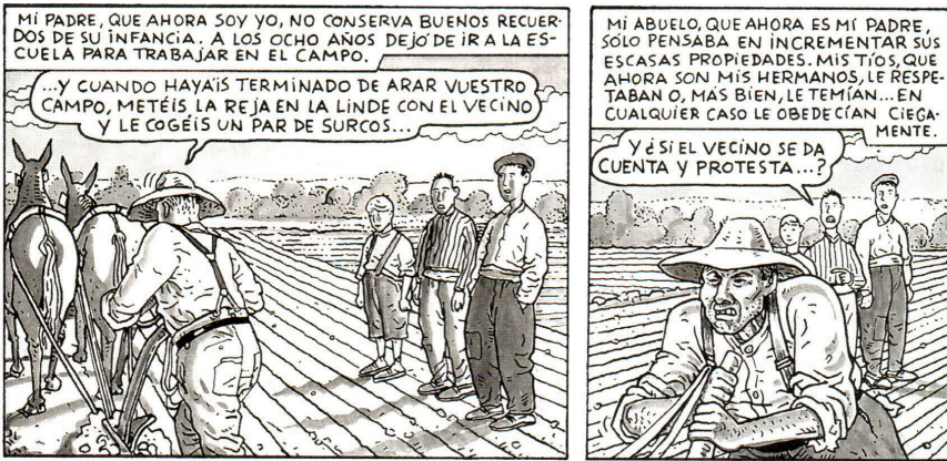
Figure 2. Antonio Altarriba et Kim, El arte de volar , Alicante, 2009, p. 19, cases 1-2

même prénom et le même nom, tous deux s'appelant Antonio Altarriba. Le fils, par la force d'un dédoublement patronymique, est donc son père, et vice versa. Inutile de dire que le fils a largement profité de cette particularité nominale pour fixer les règles de son contrat de lecture.