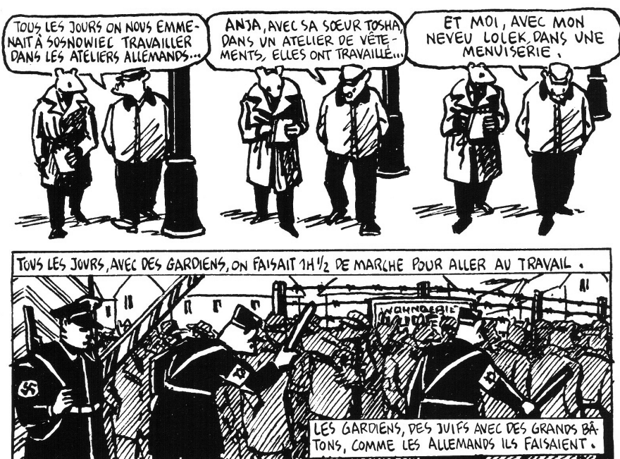
Figure 4. Art Spiegelman, Maus , tome 1, Paris, 1987, p. 106, cases 1-2

spéculaire (l'auteur-narrateur se prend comme sujet et se toise) et voyeuriste (l'auteur partage son intimité avec le lecteur), symbolisant à la fois la fidélité et la transparence, permet à l'auteur de parapher chacune des pages de son récit à la façon d'un contrat et de replacer régulièrement son histoire sur les rails des œuvres testimoniales. Art Spiegelman, en tant que fondateur de ce sous-genre qu'est la bande dessinée testimoniale, familiale et de type bio-autobiographique, s'est expliqué sur les raisons qui ont prévalu à son choix de stratégie narrative :