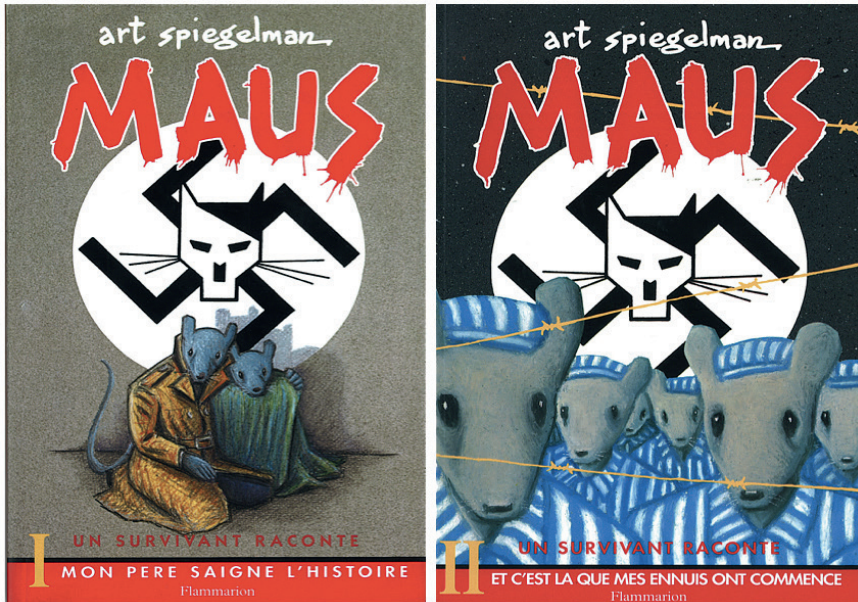
Figure 3. Art Spiegelman, Maus , Paris, 1987 et 1992 © Flammarion

ses ennuis. Reste le sous-titre principal, très habile par sa neutralité énonciative, qui relève autant du fils que du père et autant de la biographie que de l'autobiographie : «Un survivant raconte.»