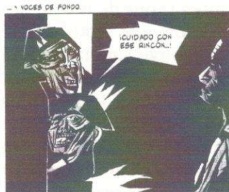
3. Deux gardes civiles hilares. "El traslado", p. 48, case 1.

Nous pourrions encore nous étonner, avec le récit intitulé "El duelo" (p. 53-60), de la curieuse façon qu'avaient les oblates de l'Assomption de la prison d'Amorebieta de respecter les dépouilles des prisonnières décédées en les stockant dans les clapiers à lapins de leur basse-cour avant de les enterrer 16 .