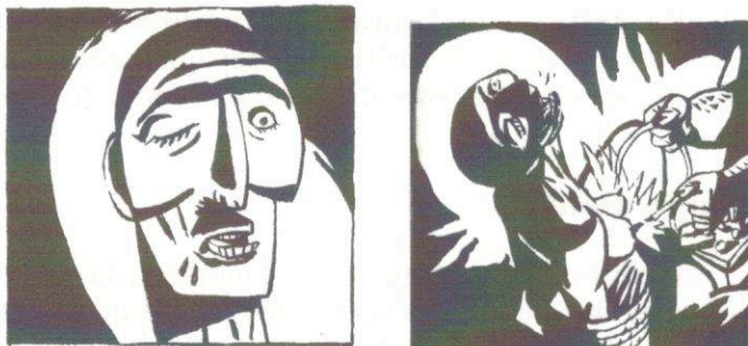
2. Scène de torture.

"El cuarto bajo la escalera", p. 31, case 4 et 6.