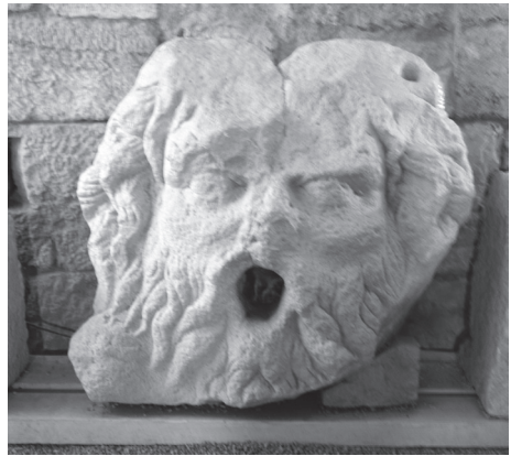
Fig. 2. Élément ornemental appelé "masque d'Apollon". Forteresse de Polignac.

Dans les parties concernées par des sondages archéologiques menés en 2004 et 2007 7 , la stratigraphie d'occupation est peu conservée sur le substrat rocheux à cause, de l'érosion du site. Par ailleurs, les constructions médiévales ont parfois dû excaver le sol détruisant ce qu'il aurait pu exister