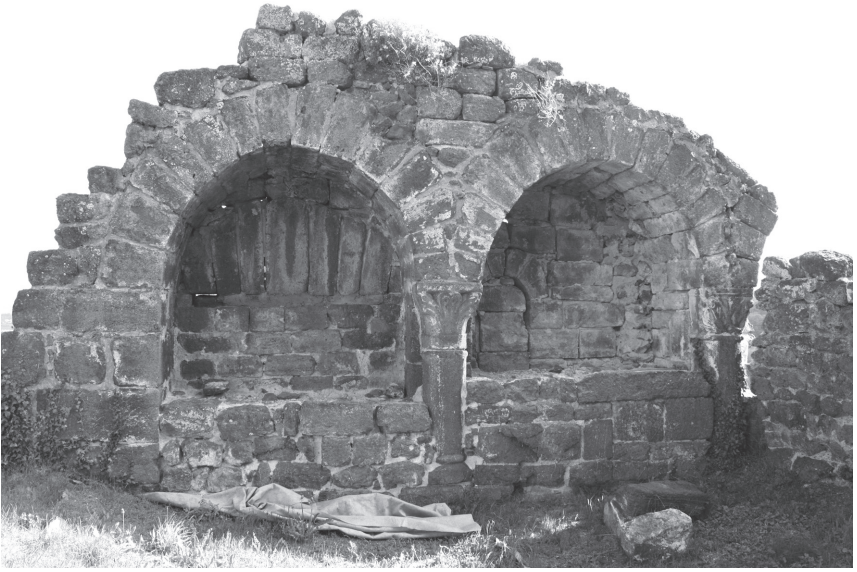
Fig. 8. Vue de la série d'arcatures situées face interne du mur sud au premier niveau à l'est (Cl. Mélinda Bizri).

aristocratiques connues dans le nord de la France. Il s'agit de surcroît, pour l'édifice de Polignac, qui se distingue par la présence d'un double-voisseau – puisque la majorité des aulae n'en comporte qu'un – d'un exemple rare et exceptionnel pour le Massif Central.