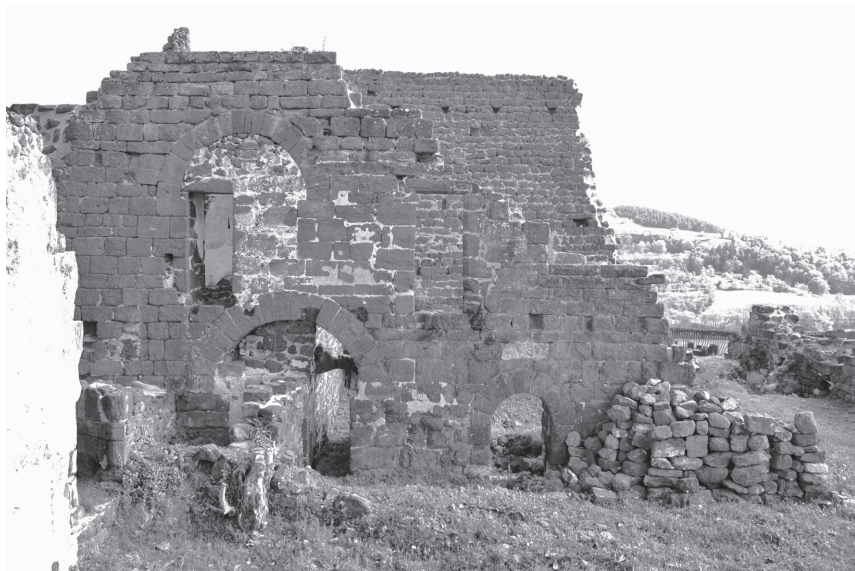
Fig. 6. Vue de la partie ouest de la façade nord.