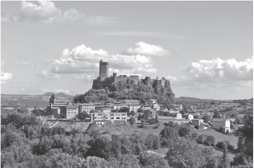
Fig. 1. Vue du site de Polignac depuis l'ouest.

Polignac est un site remarquable du Velay. Célèbre par la famille seigneuriale qui l'a occupé 1 et imposant dans le paysage – la forteresse culmine à 800 mètres de hauteur sur une large plateforme basaltique visible à des kilomètres à la ronde (fig. 1) – le site castral médiéval reste cependant assez mal connu. Récemment, les recherches historiques et archéologiques menées en 2007 2 ont permis de renouveler les connaissances et de comprendre comment le site de Polignac s'est construit et développé autour de la mythification de ses origines.