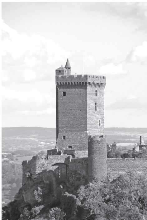
Fig. 9. Vue de la tour depuis l'ouest.