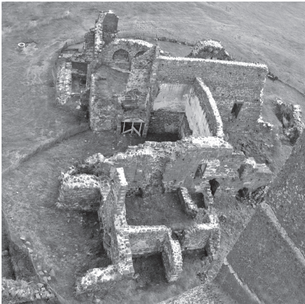
Fig. 4. Vue de l’ensemble de “La Seigneurie” depuis la tour et depuis le nord-est.

Sous les vestiges encore en élévation, la fouille a permis de dégager des trous de poteaux creusés dans le substrat rocheux. Ils indiquent une phase antérieure d’occupation, du type bâtiment en bois, sans que les éléments archéologiques mis au jour ne permettent d’en préciser ni l’emprise totale, ni la chronologie, ni la fonction 18 . En effet, la fondation de l’ensemble en pierre sur une série de banquettes rocheuses taillées dans le substrat rocheux a malheureusement oblitéré toute stratigraphie antérieure.