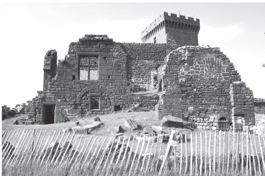
Fig. 7. Vue de la façade sud.