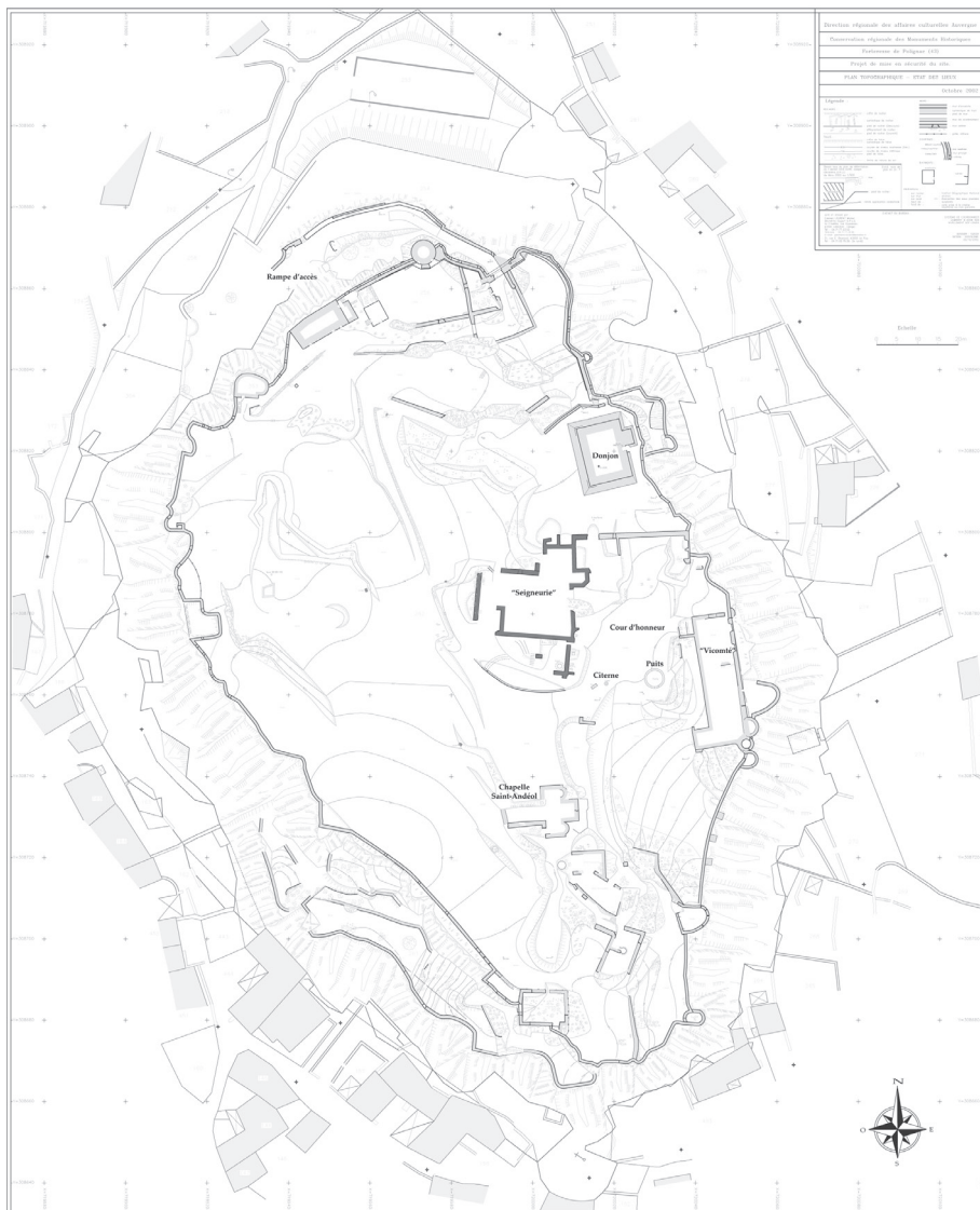
Fig. 3. Plan général du site, D'Agostino et al. 2008, vol. 2, Planche I.

Août 2007. Fond de plan : C.R.M.H. / Cabinet Michel LEURENT, 2002 DAO : L. D'Agostino