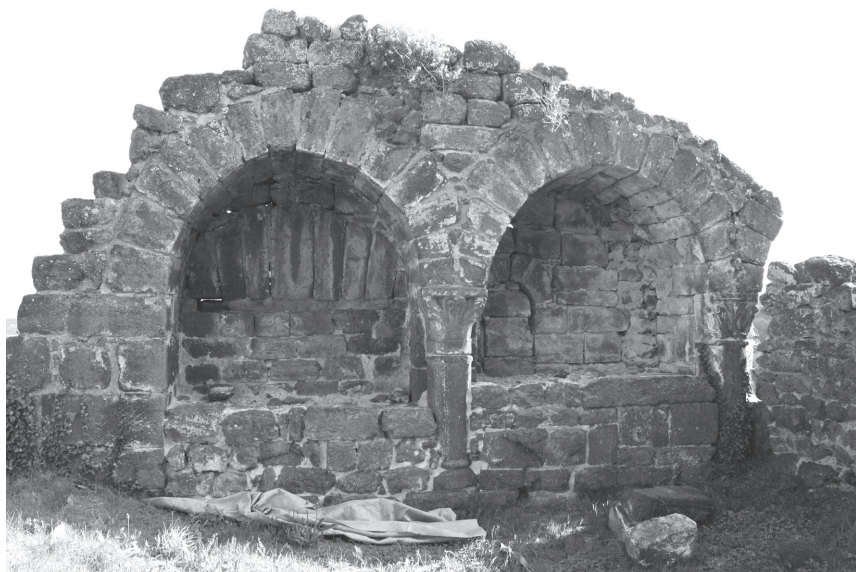
Fig. 8. Vue de la série d'arcatures situées face interne du mur sud au premier niveau à l'est.

aristocratiques connues dans le nord de la France. Il s'agit de surcroît, pour l'édifice de Polignac, qui se distingue par la présence d'un double-voisseau – puisque la majorité des aulae n'en comporte qu'un – d'un exemple rare et exceptionnel pour le Massif Central.