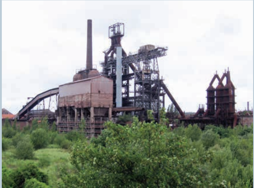
1. Haut fourneau, Uckange, juin 2006.