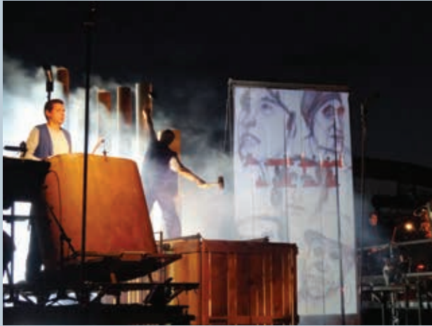
8. « MétalOrchestre / virée(s) vers l'Est », Compagnie Métalovoice, juin 2014.