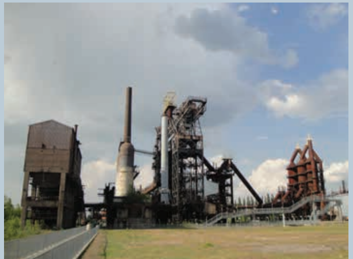
4. Cheminement et belvédère.