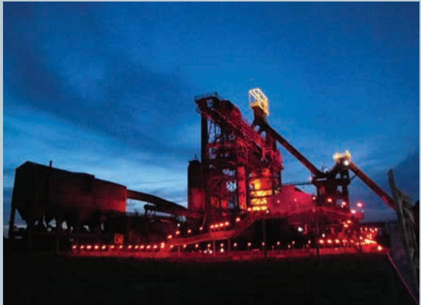
2. Claude Lévêque, Tous les soleils , 2007. Projecteurs avec filtres rouges et orangés, tubes fluo rouges et lampes à infra rouge, cheminement et belvédères en métal galvanisé, jumelles et panneaux d'orientation, peinture or.