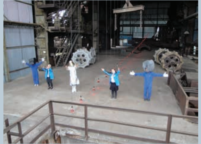
9. « Rien à voir », Compagnie Deracinemoa, 2011. Scène finale sur le plancher de coulée.