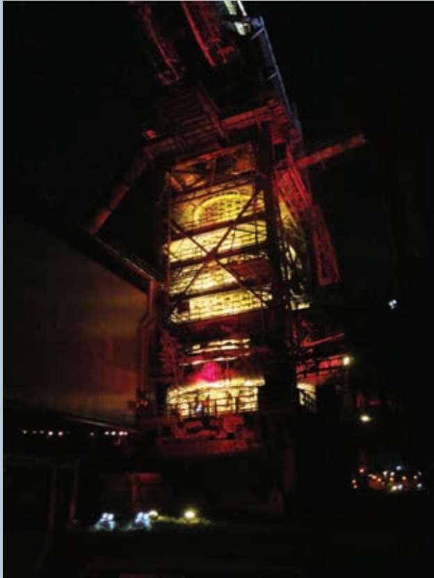
3. Claude Lévêque, Tous les soleils , 2007 (détail).