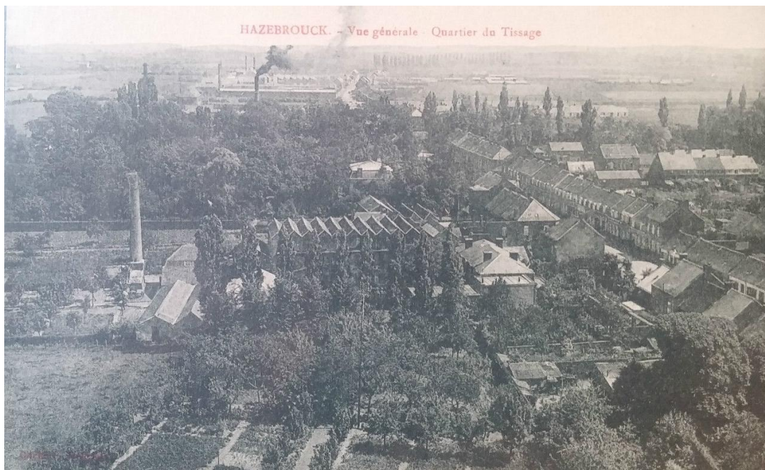
Vue générale du quartier du Tissage d'Hazebrouck à la Belle époque (carte postale)

machinisme comme lors des grèves des mégissiers de Graulhet qui ont lieu peu après celle de Hazebrouck et sur lesquels Léon de Seilhac a également enquêté 37 . Dans le Nord, les grèves sont également récurrentes dans l'industrie textile. A Hazebrouck, un long conflit qui dure de mai à octobre 1904 a lieu dans le tissage Tersen – concurrent de celui de Plancke – pour protester contre les périodes de chômage dans les ateliers 38 . Même si la plupart de ces conflits portent sur des questions salariales, certaines interrogent aussi les transformations de l'organisation du travail et des méthodes de production.