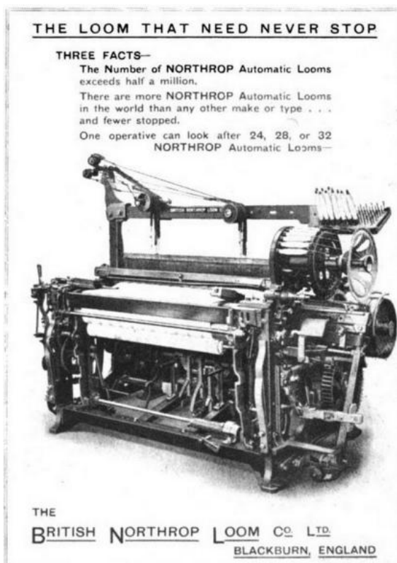
Publicité pour le métier Northrop construit en Angleterre au début du XXe siècle : « Le métier qui n'a jamais besoin de s'arrêter » 13 .

de Chicago, avant d'être commercialisée dès l'année suivante. 30 000 exemplaires sont montés aux Etats-Unis entre 1895 et 1900. Ils permettent une spectaculaire économie de main-d'œuvre puisqu'un ouvrier peut désormais conduire jusqu'à 16 voire 24 métiers à la fois. Ils pouvaient par ailleurs tisser des articles aussi variés que des calicots, des cretonnes, des coutils croisés et des satins. La rapidité de son adoption outre Atlantique s'explique par la forte croissance industrielle que connaît alors ce pays où la pénurie constante de main-œuvre favorise l'adoption des métiers économisant les bras.