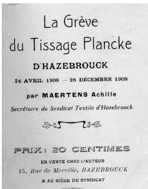
Couverture de la brochure de Maertens rédigé en réponse à l'enquête de Léon de Seilhac.

L'opuscule de Seilhac est publié dans ce contexte et suscite immédiatement de vives réactions des tisseurs. Son enquête est en effet discutée par les grévistes, et le 5 juin la commission syndicale réunie chez Achille Maertens décide de « faire imprimer à son tour un petit livre pour réfuter certains faits contenus dans celui de Léon de Seilhac » 55 , phénomène unique où les acteurs d'une grève prennent l'initiative de répondre et réfuter eux-mêmes une enquête les concernant. Dans sa contre-enquête le dirigeant du syndicat des tisseurs s'en prend avec une rare violence à Léon de Seilhac accusé de partialité, de servir les intérêts du patronat en diffusant des informations mensongères. Léon de Seilhac est repoussé comme un observateur bourgeois ignorant des conditions locales.