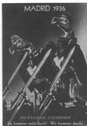
John Heartfield « Madrid 1936 » 1936, 38 x 28 cm © Valencia. IVAM

« utilise la photographie comme une arme 11 » a notamment été repris de bon cœur par El Cubri. Il en va de même pour un certain nombre d'autres préceptes du maître du photomontage politique comme l'usage indiscriminé de toutes les formes de culture, de la plus noble à la plus populaire tant que cela n'attente pas à la lisibilité du photomontage pour le grand public. Le photomontage étant avant tout conçu comme une arme de propagande dans la lutte des classes, toute son efficacité repose sur la clarté de son message.