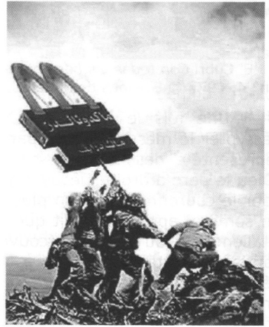
Josep Renau, Pax Americana