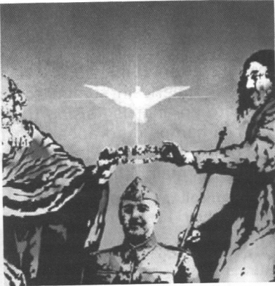
El Cubri Con todas las bendiciones , n° 4, 1977 © Edicions de Ponent, 2006

Heartfield tout autant que les artistes du pop'art, de la nouvelle figuration ou El Cubri font cause commune avec Debord et les situationnistes qui disaient que « la principale force d'un détournement [est] fonction directe de sa reconnaissance, consciente ou trouble, par la mémoire 16 . »