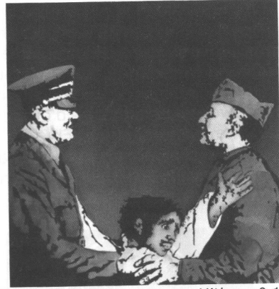
El Cubri, Franco pacta con Hitler , n° 14, 1977 © Edicions de Ponent, 2006

Une fois le tableau ou, tout au moins, le peintre reconnu, reste à décrypter le message porté par le détournement. Pour le tableau de Velázquez représenté ci-dessus, le message semble assez transparent. C'est toute la trinité (Dieu le père à droite, Jésus à gauche et le Saint-Esprit au milieu) qui est réunie pour le couronnement non plus de la vierge Marie mais de Franco en uniforme. En somme, après avoir dit que le franquisme était un petit frère du fascisme à l'italienne et du nazisme (couverture n°1), il s'agit à présent de dénoncer le soutien apporté par l'Église à la dictature et aux crimes de Franco. Quant au détournement de la célèbre photo prise en gare d'Hendaye en 1940 qui a immortalisé la poignée de main entre Franco et Hitler, il est aussi des plus efficaces. En venant placer entre les mains des deux dictateurs la victime aux bras dressés du Tres de mayo de Goya, El Cubri fait d'Hitler et Franco les nouveaux bourreaux du peuple espagnol. De la poignée de main il ne reste que des mains d'étrangleurs qui, grâce à un jeu d'échelle consistant à grandir les uns et à rapetisser l'autre, ne font que renforcer l'écrasante puissance des fascismes sur le peuple désarmé.