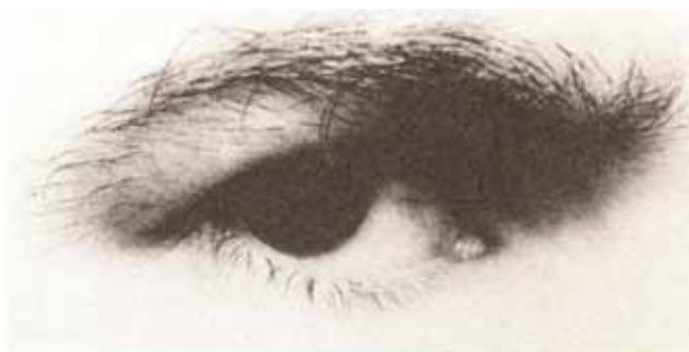
SUSO DE TORO, Photo n° 1 (p. 9), 1993, papier, 7x3,8 © Suso de Toro

Observons en premier lieu que tous ces membres et organes disséminés dans le roman n'ont pas le même statut et n'inspirent pas tous avec la même force le sentiment d'éclatement du corps. Il y a tout d'abord ces yeux dont la position préliminaire et postliminaire est si stratégique qu'elle leur confère d'emblée une importance supérieure à celle des autres parties du corps exposées dans Tic-Tac .