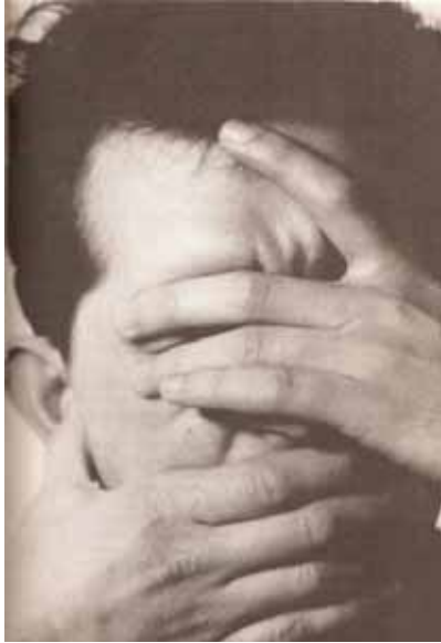
SUSO DE TORO, Photo n° 9 (p. 237), 1993, papier, 21,5x14,2 © Suso de Toro

Le dernier effet de miroir évident entre texte et photo concerne le cliché n° 9 où l'on voit le visage d'un homme (l'auteur) recouvert par ses deux mains. En effet, à bien y regarder, les phalanges de sa main droite sont plaquées contre sa bouche, et son pouce, lui, à l'autre extrémité, est logé dans son oreille droite ; sa main gauche, quant à elle, lui recouvre les deux yeux, et il y a tout lieu de penser que son pouce, qui est dans le hors champ, est lui aussi logé dans son oreille gauche. Ainsi entravé, l'homme ne peut ni voir, ni entendre, ni parler. Cette mise en scène autistique de repli sur soi et de refus d'affronter une réalité extérieure déplaisante trouve son pendant verbal dans un récit intitulé « Filosofía » (p. 123) dans lequel on peut lire :