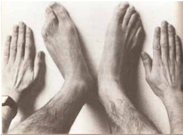
SUSO DE TORO, Photo n° 7 (p. 182), 1993, papier, 10,5x14,2

À cet égard, les photos n° 6 (la main) et 7 (pieds et mains) sont très parlantes : dans les deux cas, les membres sont volontairement isolés du reste du corps qui est rejeté dans le hors champ ce qui ne fait que renforcer l'impression de morcellement et de dissémination. Plus globalement, quand on dresse une liste des morceaux de ce puzzle humain, on trouve des yeux, des pieds, des mains, un front, un bas de visage, une tête, mais pas de corps capable d'unir ces éléments. En effet, ce n'est pas l'absence du pénis, comme dans le mythe osirien qui pose problème ici, mais l'absence complète et obstinée du tronc, ce qui est bien plus grave, puisque c'est à lui que revient la lourde tâche d'articuler et de « vertébrer » toutes les autres parties du corps. Sans tronc, donc sans colonne vertébrale, il est impossible de coordonner quoi que ce soit et encore moins de donner une forme à un ensemble qui en manque singulièrement. Or, cette incapacité à se percevoir et à se concevoir comme un ensemble unitaire, coordonné et cohérent renvoie au problème d'une nation et d'une identité nationale galicienne qui, selon Suso de Toro à cette époque, était un véritable sujet d'inquiétude 16 .