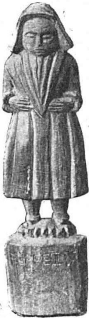
Fig. 11. — Bois sculpté. (Collection du Dr A. Marie.)