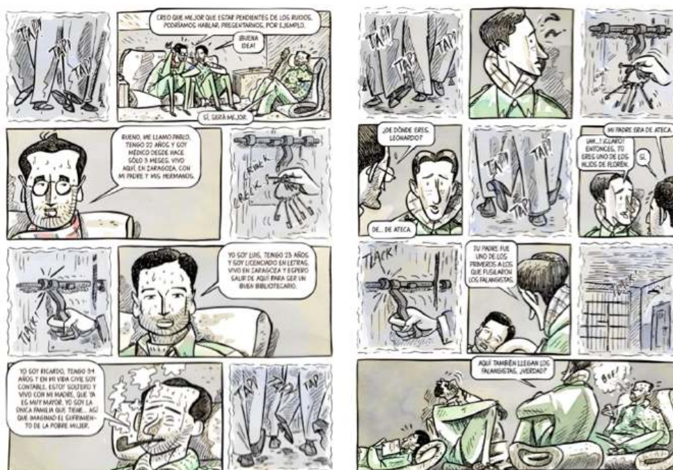
© Astiberri, p. 84 et 90.