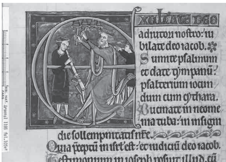
Fig. 1. Le roi David et deux joueurs d'instruments (trompe et flûte)

©Bibliothèque nationale de France, Arsenal, Ms. 1186, Psautier de Blanche de Castille, vers 1250, f. 105v.