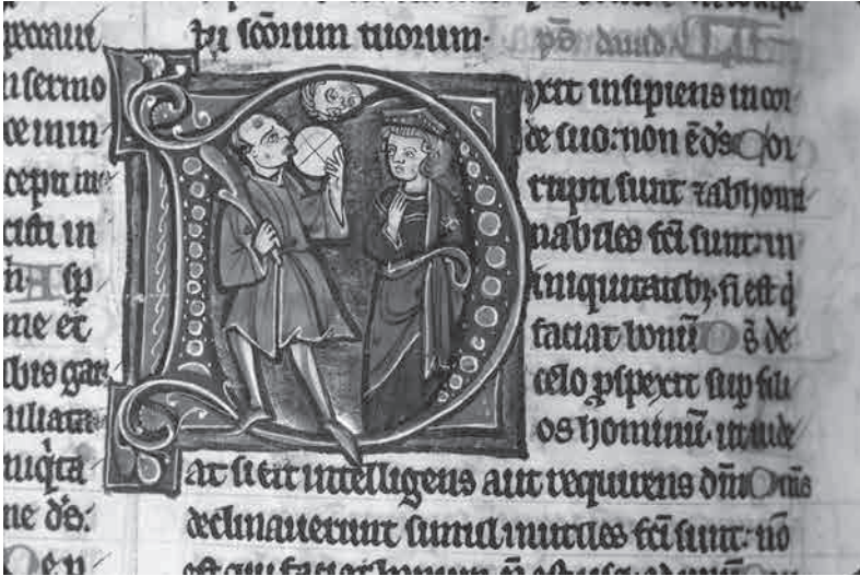
Fig. 5. Le blasphème de l'insensé envers Dieu

Bible, XIII e siècle, Ms. 4, f. 245.