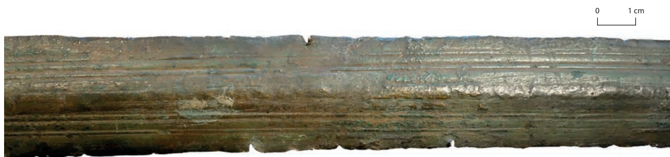
Figure 1 : Tranchants endommagés sur une lame d'épée à poignée métallique de provenance inconnue, Bronze final III (BnF, Cabinet des Médailles, 2043).

Il demeure néanmoins délicat de se prononcer sur la fonctionnalité de ces épées en l'absence d'expérimentations. La diminution de la qualité de l'emmanchement doit a minima traduire un changement dans l'utilisation de ces armes, voire une conception dans un autre but qu'une utilisation guerrière. S'il est difficile de cerner les intentions qui sous-tendent la fabrication de certaines pièces, il existe quelques exemplaires qui ne laissent pas de place au doute. Ainsi, les épées miniatures (Warmenbol 2001 ; Notroff 2015), les armes votives