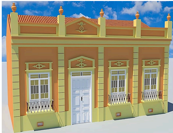
Figura 3: Modelo ilustrativo de um processo de descaracterização, por meio de análise comparativa. Em cima: uma edificação do estilo Eclético, considerada como íntegra; embaixo: a mesma edificação com um processo de descaracterização. Fonte: RODRIGHIERO, 2018.

Apesar disso, a primeira descrição acerca da descaracterização arquitetônica, é feita pelo Programa de Preservação do Núcleo Histórico de Paracatu (1984), cujo considera que edificações com descaracterização, são aquelas que passaram por reformas que alteraram às características originais, onde, muitas vezes, por meio de novas intervenções, é possível retornar às características originais (TURKIENICZ; MALTA, 1986). Desta forma, se considera que a descaracterização representa a perda das características e a sua nomenclatura, não tem a intenção de desqualificar o imóvel, mas sim, mensurar a sua preservação (Figura 3).