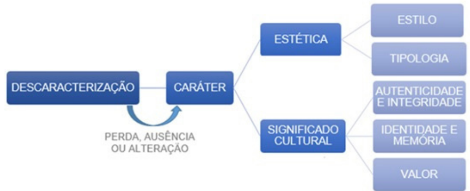
Figura 4: Fluxograma do conceito de descaracterização.

5 A presente citação, refere-se ao Dicionário Histórico de Arquitetura, organizado em 1992 por Valéria Farinati e Georges Teyssot, que reúnem às principais considerações feitas por Quatremère de Quincy.