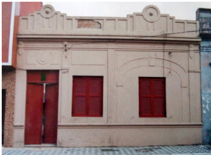
Figura 8: Exemplo de análise comparativa, de imóvel de tipologia Corredor Lateral, denominado "Corredor Lateral-01" e classificado no método com grau II; em 1987 (em cima), e em 2018 (embaixo).

No grau III, somente 3 edificações somaram entre 5,1 a 6,9 pontos e foram inseridas neste grau. Diferente dos anteriores, nestes imóveis, já é possível verificar a presença de descaracterizações leves, médias e também graves, que podem afetar diretamente na arquitetura da obra. O quarto exemplo (Figura 9), apresenta as descaracterizações de uma edificação de tipologia corredor lateral, onde foram identificadas a substituição de telha original por telha fibrocimento (material diferente), abertura de vãos, substituição de esquadrias com alteração na verticalidade e horizontalidade, variação nos elementos em massa e a presença de elementos descaracterizantes, como toldos e aparato publicitário.