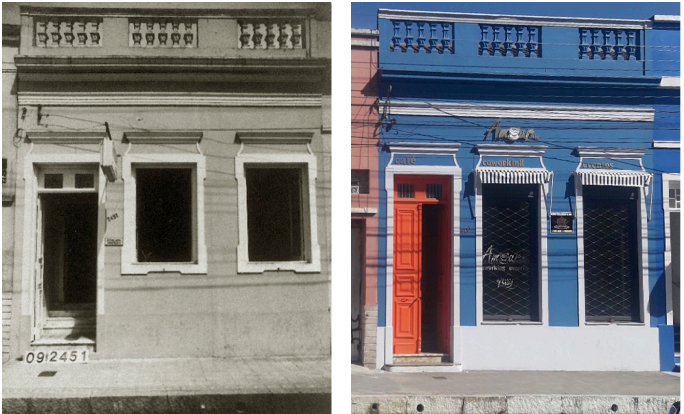
Figura 9: Exemplo de análise comparativa, de imóvel de tipologia Corredor Lateral, denominado “Corredor Lateral-06” e classificado no método com grau III; em 1987 (à esquerda), e em 2018 (à direita).

No último grau, estão inseridas 6 edificações, que somaram 7 pontos ou mais. Este grau, se difere dos demais pois, integra somente os imóveis que apresentam um alto índice de descaracterização, com um conjunto de descaracterizações leves, médias e graves. Para mais, tais descaracterizações, podem ser invasivas a tal ponto que podem comprometer, inclusive, o estilo e a tipologia da obra. O último exemplo (Figura 10) apresentado, denota tais apontamentos, visto que, na edificação são verificadas a presença de: fechamento de vãos, substituição de telha original por fibrocimento de esquadrias (com alteração na forma), aparato publicitário, acréscimo de paredes, acréscimo e remoção de revestimentos e, alteração na sua volumetria — que não foi possível identificar se foi demolição completa ou não.