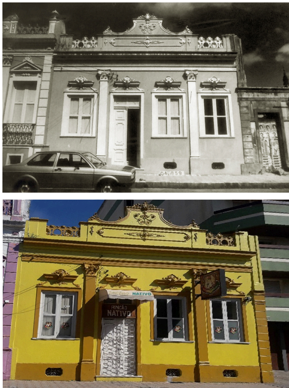
Figura 7: Exemplo de análise comparativa, de imóvel de tipologia Corredor Central, denominado “Corredor Central-03” e classificado no método com grau I; em 1987 (em cima), e em 2018 (embaixo).

Já no grau I, foram inseridas boa parte das edificações da amostragem e, todas somaram entre 1,1 a 3,0 pontos. Neste grau, nas 10 edificações enquadradas, ainda constam edificações com ótima preservação, no entanto, com maior incidência de descaracterizações leves, porém, não tão invasivas a ponto de afetar a leitura da obra. Conforme a ilustra a análise comparativa da Figura 7, foi identificado a presença de três elementos descaracterizantes, sendo a: inserção de toldo, grades e aparato publicitário.