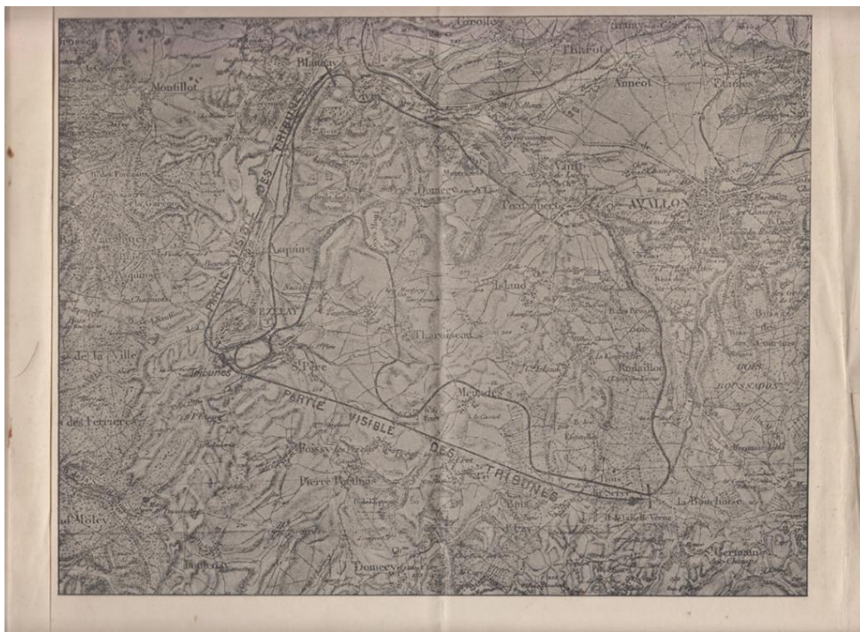
Figure 1. Le plan du circuit

Le site retenu pour installer l'autodrome est entre Avalon, petite sous-préfecture dont la population stagne alors en dessous de 6 000 habitants, et Vézelay, célèbre pour sa basilique, mais alors en déclin. Le projet élaboré par l'ingénieur Bouillé prévoit entre les deux villes la construction d'« un circuit fermé de 44 km avec une rampe de 10 % sur 2 km, une ligne droite de 4 km en palier (on n'en exigeait que 2), le tout complètement indépendant des routes et des chaussées de la région » 29 . De vastes tribunes installées en hauteur, au sud et à l'ouest, doivent permettre aux spectateurs de suivre la course.