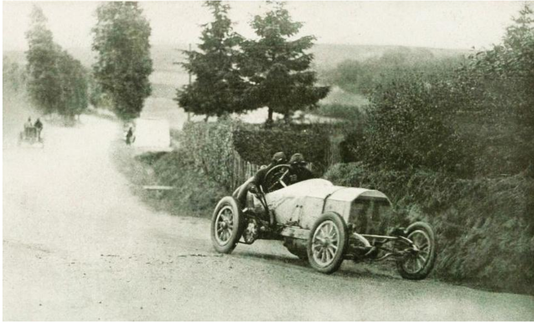
Figure 3. L'Allemand Christian Lautenschlager, vainqueur du Grand Prix de Dieppe en 1908 sur Mercedes