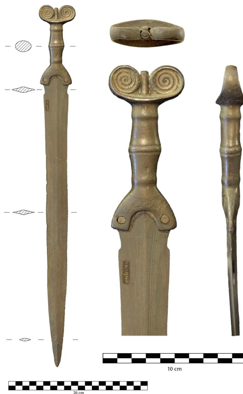
Fig. 1. L'épée d'Onnen (Groningue, Pays-Bas) (Clichés et DAO : L. Dumont).

L'épée d'Onnen est une petite épée (fig. 1). Elle ne mesure que 52 cm, avec une poignée de 11,5 cm et une lame dont la longueur visible n'est que de 40,5 cm. Le manche débute par un pommeau formé de deux spirales enroulées de manière dense, entre lesquelles se situe une épine centrale qui dépasse du centre du pommeau par une ouverture prévue à cet effet. Cette épine est de section ovale et ornée de fines stries horizontales. Une autre tige métallique, de section plus ou moins quadrangulaire, est également fichée dans cette même ouverture (fig. 1-2). Le pommeau surplombe une fusée bombée, parcourue de trois bourrelets horizontaux. Le renflement central est encadré de deux sillons. La garde est campaniforme et présente une échancrure en U, autour de laquelle sont placés deux rivets à tête plate. À en juger par l'espace laissé dans l'interstice entre la poignée et ces rivets (fig. 2), ceux-ci ne doivent pas jouer un rôle fondamental dans l'emmanchement. La corrosion à l'interface entre la poignée et la lame nous indique que la première a d'ailleurs bougé, que ce soit lorsque l'épée était utilisée ou durant son histoire récente.