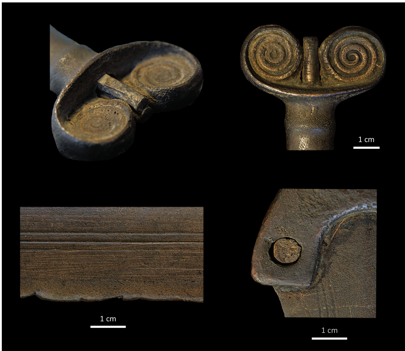
Fig. 2. Détails de l'épée d'Onnen (Groningue, Pays-Bas). En haut : détails du pommeau. En bas à gauche : détails des dommages des tranchants de la lame. En bas à droite : détail d'un des rivets de la poignée. (Clichés : L. Dumont).

La lame débute par un ricasso , partie non affûtée juste sous la poignée. Elle est très légèrement pistilliforme, avec une largeur maximale de 3,6 cm et une épaisseur moyenne de 0,8 cm. Elle est simplement ornée de six fins sillons répartis en deux groupes de trois disposés symétriquement de part et d'autre du renflement central. Les tranchants sont intacts dans la moitié supérieure de la lame, mais présentent des dommages dans la moitié inférieure. Outre quelques petites encoches en V pouvant correspondre à des chocs contre des objets tranchants, un des côtés est totalement déformé et aplati sur une vingtaine de centimètre (fig. 2). Ces déformations importantes, qui ne s'accompagnent d'aucune perturbation de la couche de corrosion, datent vraisemblablement de l'âge du Bronze. Les zones aplaties témoignent de chocs répétés contre une surface plane ou d'un martelage répété dans cette région de la lame afin d'en supprimer le tranchant.